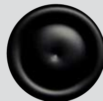
Oben: Die einzigartig konstruierte Membran des EWB Hochtöners endet in der Mitte auf einem Metallstift